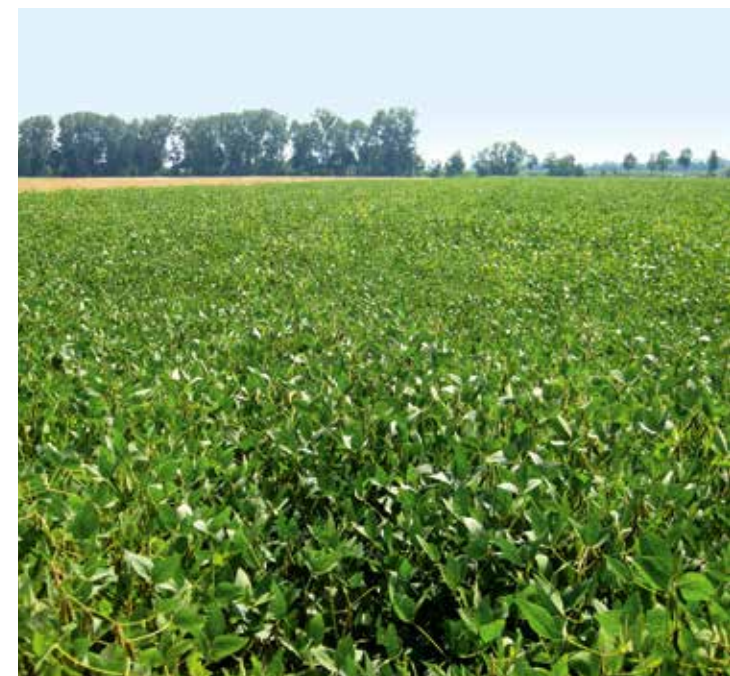
Quelle: LSV 2015, Baden-Württemberg (5 Standorte), Bayern (5 Standorte), Hessen (2 Standorte)